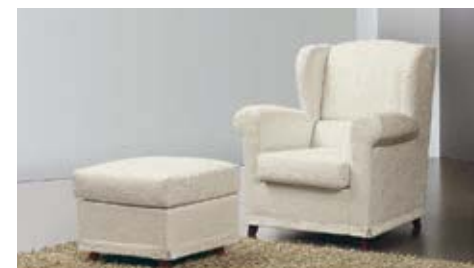
Art. 14 Pouf inclinato Shaped pouf Pouf incliné