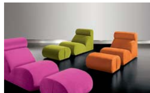
Art. 13 Pouf Pouf Pouf